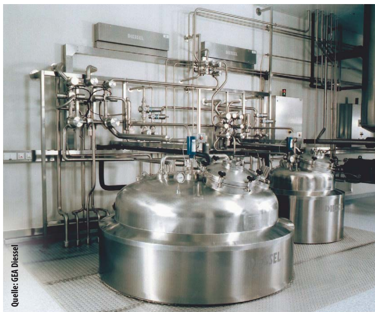
Traditionell haben viele Firmen ihre Anlagen direkt ins Gebäude verbaut.

Während der Pharmahersteller das existierende Gebäude entkernt und für den Aufbau neuer Anlagen vorbereitet, produziert, testet und optimiert der Anlagenbauer die Prozessmodule. Bei Neubauprojekten entstehen Gebäude und Anlage zeitparallel, aber räumlich getrennt voneinander. In beiden Fällen hat sich die Modulbauweise bewährt, da der Bauherr bei der Projektabwicklung wertvolle Zeit gewinnt.