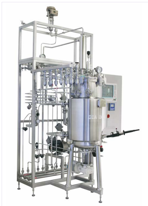
Der 100-Liter-Bioreaktor-Skid ermöglicht eine schnelle Installation.

gen werden die Skids nach ihrer Fertigstellung zum Zwecke des Transportes voneinander getrennt und nach der Aufstellung am endgültigen Bestimmungsort reinstalled. Dieser Umstand führt in der Regel zwar zu höheren Kosten, allerdings bietet die Werksmontage den großen Vorteil, dass der Kunde die Anlage vor der Auslieferung umfangreich testen kann. Durch den temporären Anschluss an die benötigten Energien, wie Kühlwasser, Heißdampf oder Druckluft können die Ingenieure komplette Produktionsprozesse weitgehend simulieren und testen.