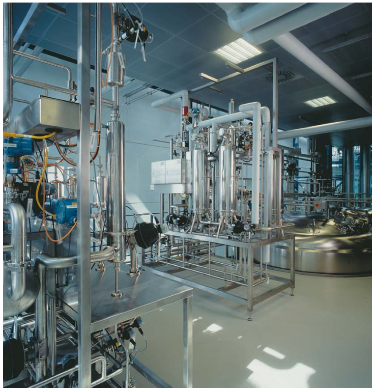
Werkseitig vormontierte Prozessmodule erleichtern den Anlagenbau.

Die moderne Denkweise geht beim Aufbau neuer Anlagen vom Baukastenprinzip aus. Dabei wird die Prozessanlage in funktionale Sub-Systeme aufgeteilt. Diese Units beinhalten Prozessfunktionen, wie das Heizen oder Kühlen eines Reaktionsbehälters, die Produktfiltration oder die vollautomatisierte Inline-Reinigung.